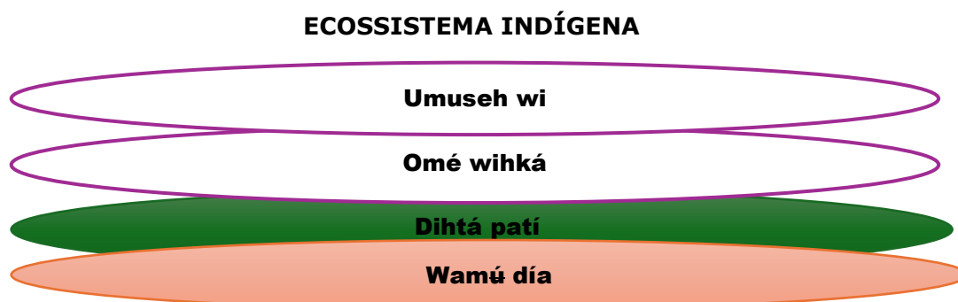
Figura 1 - Esboço de conteúdo no ensino da arte, cultura e mitologia, ministrado na escola estadual indígena “Dom Pedro Massa”

Os alunos indígenas egressos dos programas de pós-graduação, em suas dissertações ou teses de doutorado, vêm enriquecendo estas discussões de forma gradativa com abordagens das teorias científicas como: a etnomatemática, dos Bahsesé, educação indígena, transmissão de conhecimentos, os Waí-mahsã, identidade hierárquica e etnicidade, contemplados numa espécie de escolarização da cultura nas escolas indígenas. Como exemplo, colocamos o modelo adotado na Escola Dom Pedro Massa em Pari-Cachoeira.