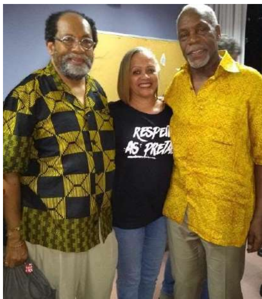
Encontro dos Movimentos Sociais em Montevideo/Uruguai