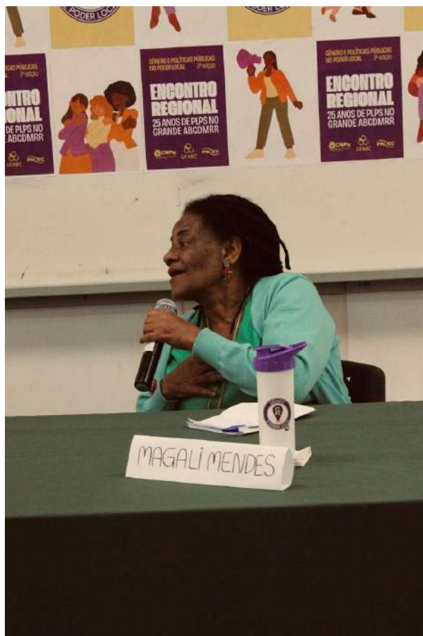
ASÉ e LUTA!

Me mantenho acreditando na luta coletiva, sou uma feminista negra, popular e anticapitalista, me reafirmo militante do FECONEZU, acreditando que a cultura é política e contribuo na organização das Promotoras Legais Populares Pretas rumo a segunda Marcha Nacional de Mulheres Negras que acontecerá em novembro de 2025, no Distrito Federal.