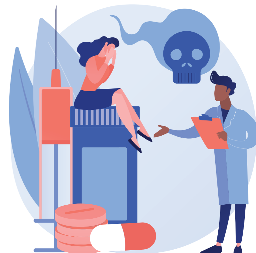
Designed by vectorjuice / Freepik

CAPS ad no Maranhão: < https://ubs.med.br/caps-ad-6050247/ >.