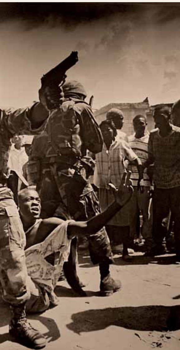
Foto premiada feita por Carol Guzy, após explosão de uma granada em Porto Príncipe, capital do Haiti, em 1994