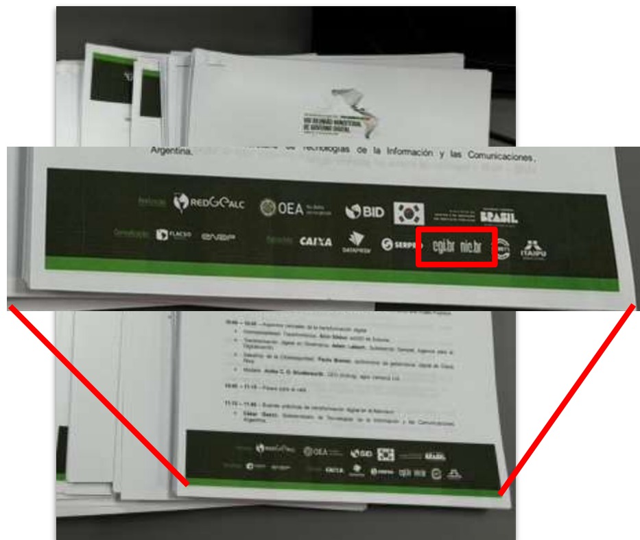
Agenda em Papel

https://redgealc.org/ministerial2024/pt/inicio/