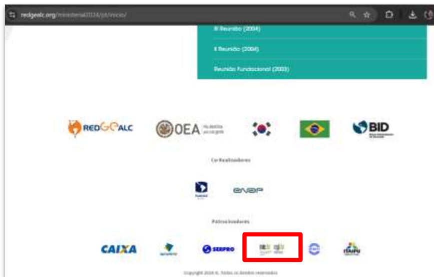
Landing Page do Evento

https://redgealc.org/ministerial2024/pt/inicio/